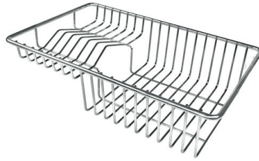
Panier à vaisselle inox 8100 303 * uniquement en combinaison avec l'accessoire 8644 101