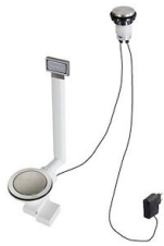
Vidange automatique Space Light - PL 8407 117