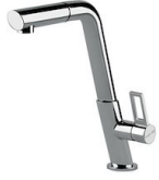
Mitigeur KE 8492 000